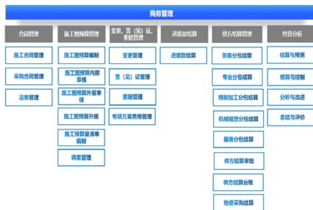
图5 商务管理子系统功能结构图

商务管理子系统包含施工合同管理、施工图预算管理、分包结算管理、采购结算管理、签证索赔管理、成本管理等模块,实现从工程结构分解到施工任务实施再到施工劳务结算的全流程流转,提高劳务结算准确性、及时性、可追溯性,实时反映结算状态、争议情况及处理情况、劳务成本等数据。功能结构如图5所示。