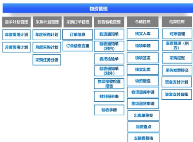
图4 物资管理子系统功能结构图

按照应用架构设计,本平台共设计了10个子系统,以物资管理子系统和商务管理子系统为例,其功能设计如下。