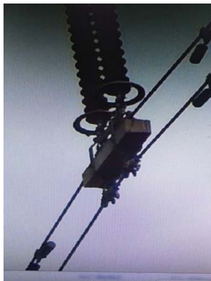
图1 双分裂导线单双串专用重锤

实际运行显示绝大部分杆塔加装导线重锤后,起到了防止导线大风时放电的预期目的,但是个别杆塔导线由于地形或该地区在雷雨、大风的强对流天气情况下,瞬时风速超过设计风速,致使风偏角超过设计要求,造成绝缘子悬垂线夹对塔身放电,造成线路掉闸。