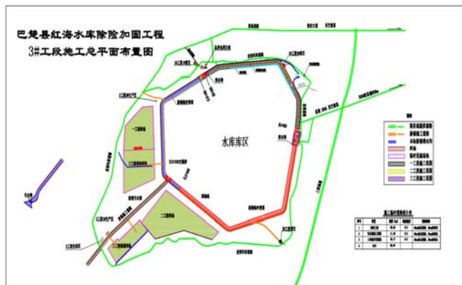
图1 坝体坝基施工降排水方案