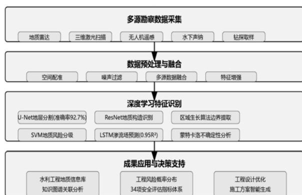
图1 水利工程地质信息智能提取与分析

水利工程地质信息智能提取与分析方法将融合后的多源数据转化为有价值勘察成果。该方法基于深度卷积神经网络与递归神经网络构建地质特征识别模型,通过迁移学习解决地质样本稀缺问题 [5] 。模型采用U-Net架构进行地层分割,利用ResNet提取地质构造特征,准确率达92.7%。对断层、岩溶带与软弱夹层等地质异常体,应用区域生长算法与主成分分析进行边界提取与属性判别。水工建筑物安全评估引入SVM分类算法,建立包